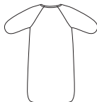
A, B, C